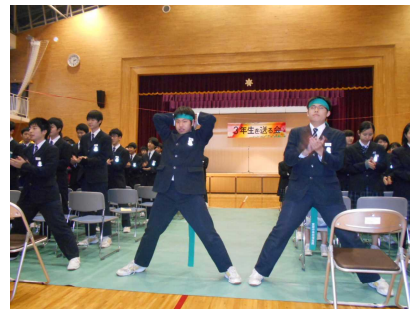
【3年生からのエール】