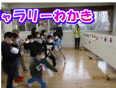
【SETSUBUN! 1~3年】 2/1