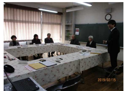
【民生児童委員連絡会】 2/15