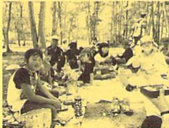
(わかきピクニック)