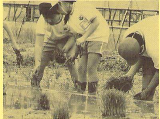
【田植え体験(総合的な学習)】

児童57名は、豊かな自然環境、温かい人的環境の中でのびのびと学校生活をおくっている。素直で明るい性格、しなやかでみずみずしい感性は、当校の児童の共通した長所である。学校、家庭、地域社会が心をひとつにし、児童の健やかな成長を願い、教育実践に努めている。