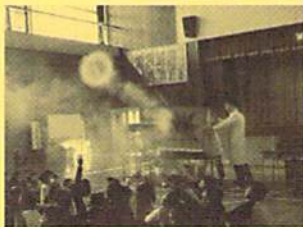
(科学巡回指導訪問)