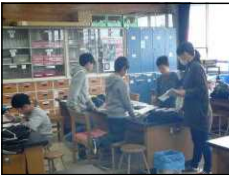
12/25, 26 書きぞめ練習会