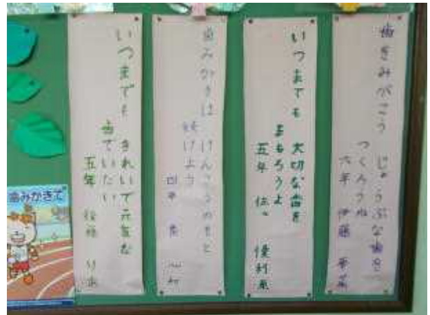
<保健委員が考えた健康標語>

保健委員会では、全校の子どもたちに歯磨きの大切さを呼びかけるため、歯磨き標語を作り、保健室前に掲示しました。