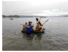
筏が浮かびました