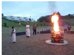
キャンプファイアー