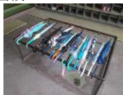
傘が整然と並んでいます