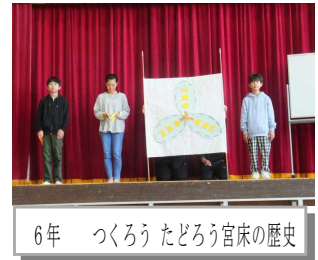
6年 つくろうたどろう宮床の歴史

当日は大勢のお客様を目の前にして、緊張の面持ちでしたが、真剣に臨むことができました。たくさんの温かい拍手に心より感謝申し上げます。