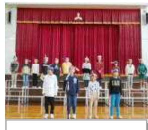
2・3年ゴーゴーイングリッシュ