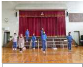
4年ゴールの先に見えたもの