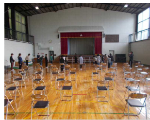
準備終わりの挨拶の様子

パイプ椅子や楽器を運んだり、会場を丁寧に清掃したりして、労をいとわぬ働きぶりは大変見事でした。このような姿勢は伝統的に受け継がれてきている本校のすばらしい面です。縦割り掃除などでは先輩学年が一生懸命働く姿を後輩たちが見ていて、その姿を受け継いでいきます。これからも大切に守っていききたい本校のすてきな伝統の一つです。