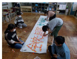
6年生スローガン作り