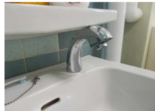
新設された自動蛇口

蛇口をひねらず、手を近づけるだけで水が出る自動蛇口が1階と2階の児童用トイレの手洗い場と、2年生教室前の手洗い場に設置されました。新型コロナウイルス感染症防止のためにも有効です。また、夏休み明けから実施していた学校坂道の舗装工事が完了しました。白線をしつかり引いてもらい、子どもたちはこれまで以上に安全に登下校できるようになりました。更に、夏休み中に屋上の防雨シートを全面的に修繕し、これまで校舎内の何カ所かで起こっていた雨漏りがなくなりました。