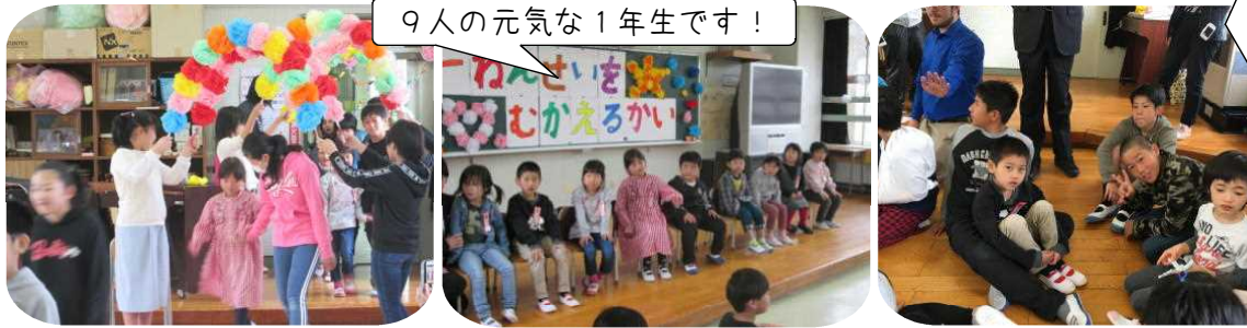
9人の元気な1年生です!

6年生と手をつないで花のアーチをくぐって入場しました。そのあと、1年生一人一人が、名前、好きな食べ物、楽しみにしていることについて自己紹介をしました。とても元気よく、はきはきとした自己紹介ができました。ゲームは、集合ゲームをしました。1年生も楽しそうに参加していました。