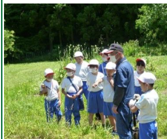
4年生：宮床ダム南川ダム 中峰浄水場見学