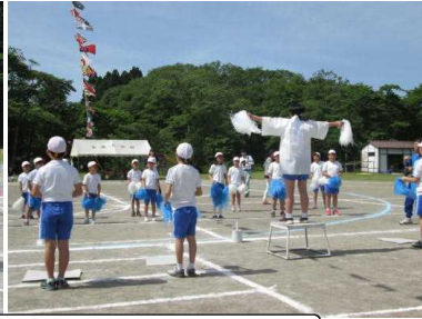
応援合戦も力が入りました。