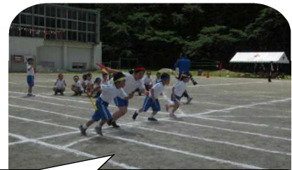
こぼとりレーは、白組Aが1位