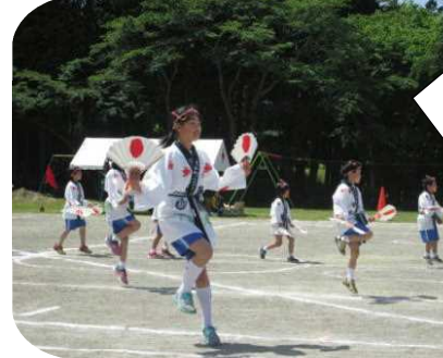
1年生も上手に踊りました！ 伝統の宮床すずめ踊り！