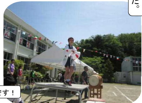
1・2年生のダンスもかわいかったです！