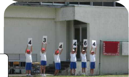
一の位、百の位が同じ、最後の十の位で結果が出て、白組優勝！