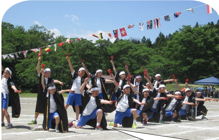
今年は、隊形移動もパワーアップ！ 最後までしっかりと決めることができました。「よさこいソーラン2018」