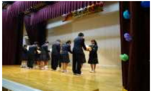
<実行委員からの花束贈呈>