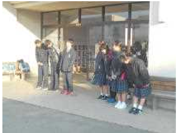
↑ 笑顔がステキな執行部メンバー