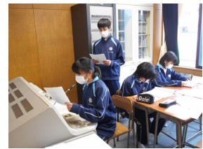
〈放送室からの報告風景〉

執行部・専門委員会・各部活動からの報告を、放送室から校内放送で行い、各学級では、資料で確認しながら、整然と放送に聞き入る生徒諸君の姿がありました。