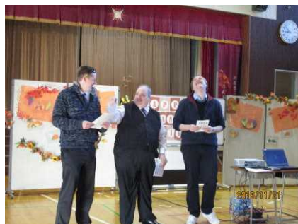
【サンクス・ギビングデー】より