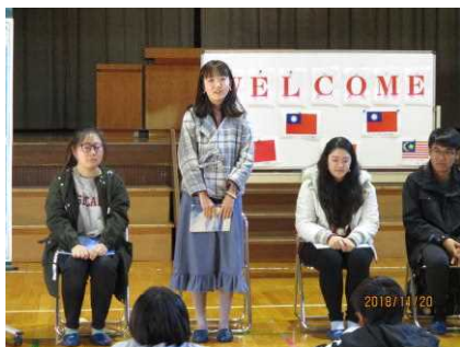
【ハローワールドデー】より

また20日には、宮城教育大学の留学生を招いて「ハローワールドデー」を開催しました。当日は、宮城教育大学の3カ国(中国・台湾・マレーシア)6名の留学生に本校に来ていただきました。どの留学生にも共通することが、英語が堪能だということです。ここに、「ハローワールドデー」の大きな意義があります。それは、落合小学校の子供たちに、母国語では伝わらないことも、英語が話せることによって会話が成立するということに気付かせたいと考えたのです。もちろん、それぞれの国の文化や言語、生活習慣や衣食住などの相違点・共通点を感じ取らせる意義もあります。今年度も「みやぎ教育月間」にふさわしい活動ができました。