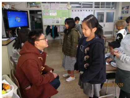
【ハローワールドデー】より