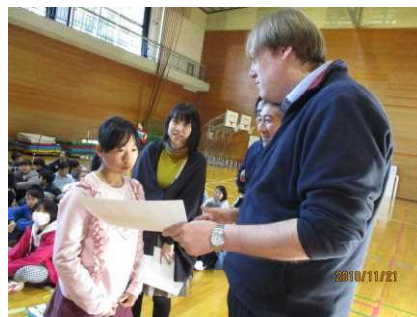
【サンクス・ギビングデー】より