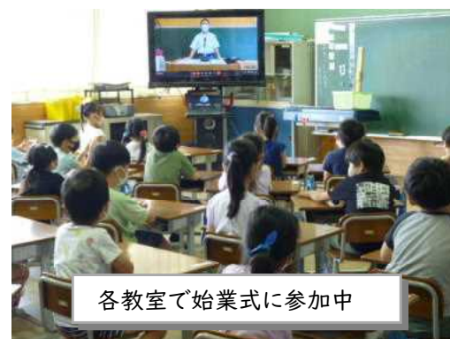
各教室で始業式に参加中