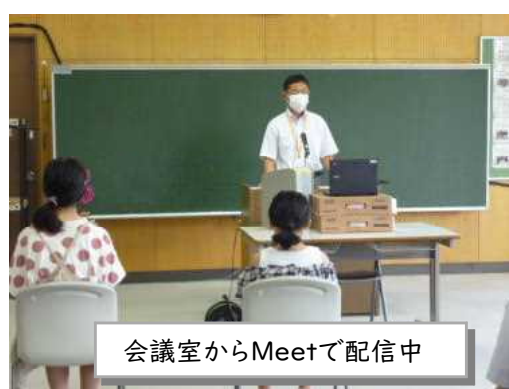
会議室からMeetで配信中