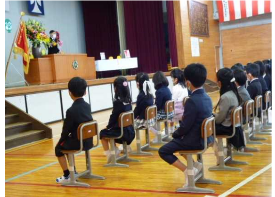
お返事も話の聞き方もとても立派な1年生

「 あ かるいあいさつ い つもげんきで う えをむき え がおかがやく お んがくだいすき」な小野小学校の子供たちのために、今年度も地域・保護者の皆様の御理解と御協力をどうぞよろしくお願い申し上げます。