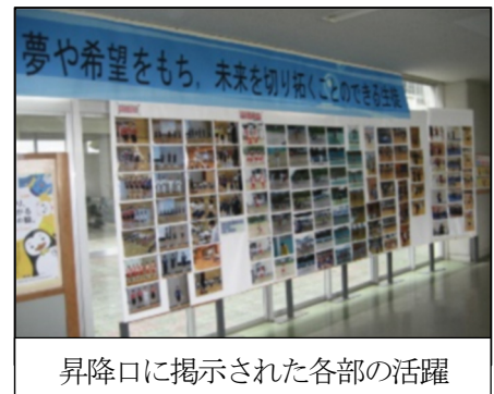
昇降口に掲示された各部の活躍