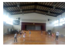
卓球バドミントンクラブ