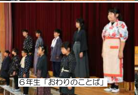
6年生「おわりのことば」