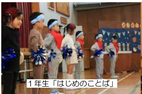
1年生「はじめのことば」

10月22日（土）に「学習発表会・一般公開」が開催されました。今年度も「来賓の御来場自粛」「各家庭2名までの御来場」「来場者への氏名・体温・健康状態のチェック」「来場者のマスク着用」「座席同士の間隔を空ける」「発表学年の保護者が前列に来る席替え制（消毒は保護者の皆様自身が行う）」「暗幕を使用せずに常時換気」などの新型コロナウイルス感染防止対策を講じた上での実施となりました。どの学年の子供たちも練習の成果を存分に発揮して、最高の演技を披露してくれました。保護者の皆様には、子供たちの衣装の準備や会場の後片付け等の御協力をいただき、大変ありがとうございました。