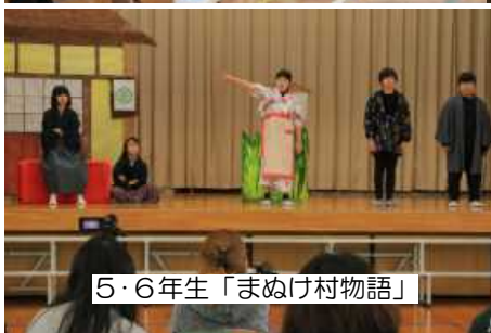
5・6年生「まぬけ村物語」