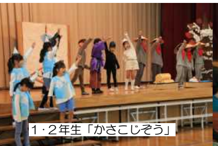
1・2年生「かさこじぞう」