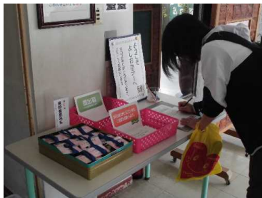
【感想カード記入の様子】

来校の際は、何かお気付きの点や感想がございましたら、下記の感想カードに御記入ください。 感想カードは、職員玄関の所に置いてあります。